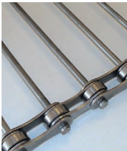
ST-HK Stavenband met kettingkanten