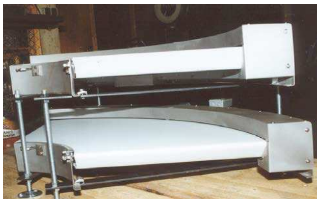
In roestvrije uitvoering