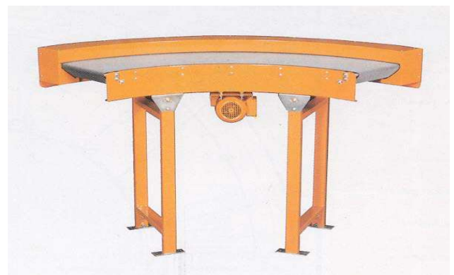
In gelakte uitvoering