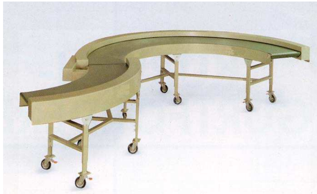
Met ondersteunings frame in verrijdbare of vaste uitvoering